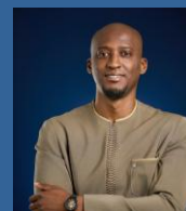
APIX長官 バティリー氏